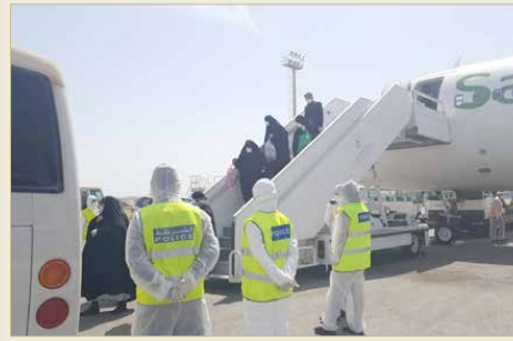
المنامة - وزارة الصحة

♦ "الصحة": توفير أقصى درجات الكفاءة في الخدمة العلاجية للقادمين