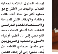
التدريس أو الاستعانة بتلفزيون البحرين عبر تخصيص بعض القنوتات لثل المواد التعليمية مع تقليص المناهج والتركيز على المحاور الرئيسية فقط، في ظل صعوبة توفير الحاسب الآلي لكل أسرة، مشيراً إلى إمكانية إلغاء الامتحانات وإيجاد طرق بديلة لتقييم الطلاب.