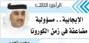
الرجل الثالث الإيجابية .. مسؤولية مضاعفة في زمن الكورونا