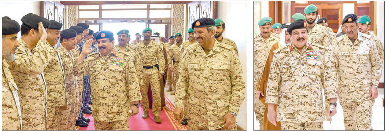
شاكراً لدى زيارته قوة دفاع البحرين الحملة الوطنية برئاسة ولي العهد.. الملك :