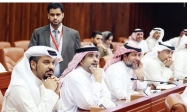
صندوق العمل تمكن لتحمل الفوائد المتكبدة المترتبة على القروض للمؤسسات الصغيرة والمتوسطة مدة ٦ أشهر.

التزامهم المالية في ظل توقف الدراسة، والسياحة بخفض الرسوم الإيجارية الشهرية في المناطق الصناعية بنسبة ٥٠٪ أو العمل بالرسوم السابقة مدة ٦ أشهر، وتجديد رسوم الأنشطة التجارية والإعطاء من الرسوم الإضافية المفروضة على كل نشاط تجاري يرغب طالب القيد في إضافته على الأنشطة الثلاثة الأولى المخددة في السجل، وتوجيه هيئة الكبرياء والماء للعمل بالترعة السابقة مدة ٦ أشهر، وتوجيه وزارة الأشغال وشؤون البلديات خفض الرسوم البلدية المفروضة على المؤسسات والشركات التجارية والصناعية بنسبة ٥٠٪ مدة ٦ أشهر، والتوجه بوقف رسوم عدل هيئة تنظيم سوق العمل مدة ٦ أشهر، وتوجيه