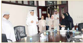
المنامة - وزارة التربية والتعليم

قام وزير التربية والتعليم ماجد النعيبي بزيارة إلى فرق العمل التي شكلتها الوزارة لتعزيز بوابتها التعليمية الإلكترونية، وتفقيتها بالدروس والإجراءات النموذجية، التي تستخدمها الأبناء الطلبة بجميع مراحلهم الدراسية في فترة تعليق الدراسة. وأشاد الوزير بالجهود الكبيرة للعاملين في هذه الفرق البالغ عددها 45 فريقاً مقسمة بحسب المواد الدراسية في مواد دراسية مختلفة، التي تعمل بإشراف قطاع المناهج والإشراف التربوي، وتضم مختصين من العديد من إدارات الوزارة، ويمتد عملها لساعات طويلة تتجاوز فترة الدوام الرسمي. وأطلع الوزير أثناء الجولة على فرق العمل، برفقة عدد من مسؤولي الوزارة، على نماذج من الدروس النموذجية الإلكترونية المصممة في مواد دراسية مختلفة.