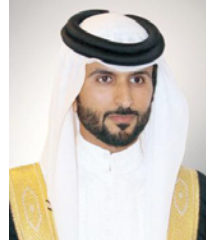
سمو الشيخ ناصر بن حمد آل خليفة

استعرضت اللجنة من خلاله مستجدات الجهود المتخذة لمواجهة فيروس كورونا (كوفيد19) حفاظاً على صحة وسلامة المواطنين والمقيمين في البحرين.