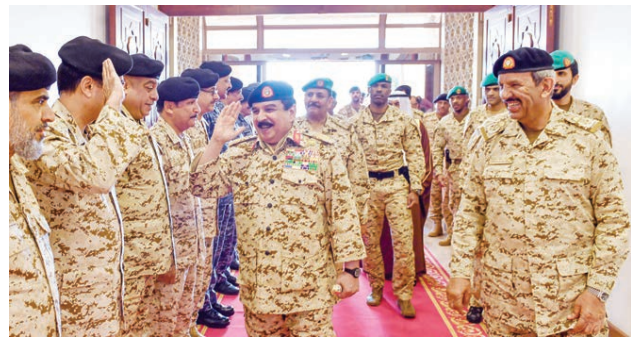
○ جلالة الملك خلال زيارته قوة دفاع البحرين.

أكد حضرة صاحب الجلالة الملك حمد بن عيسى آل خليفة ملك البلاد المعلى القائد الأعلى أن الوضع الصحي في مملكة البحرين بحمد الله مطمئن، وأنها تشهد خروج الكثير من الحالات من المواطنين والمقيمين من الحجر الصحي الاحترازي بعد أن تم فحصهم وتقديم الرعاية اللازمة لهم وعودتهم إلى منازلهم سالمين معافين. شاكراً الحملة الوطنية برئاسة صاحب السمو الملكي الأمير سلمان بن حمد آل خليفة ولي العهد نائب القائد الأعلى النائب الأول لرئيس مجلس الوزراء وجميع العاملين فيها، وكافة الطواقم الطبية والإدارية، جاء ذلك خلال زيارة جلالتهم أمس للقيادة العامة لقوة دفاع البحرين.