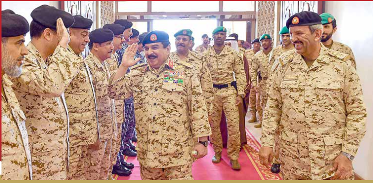
جلالة الملك في زيارة للقيادة العامة لقوة الدفاع