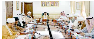
اجتماع المجلس الأعلى للشؤون الإسلامية

♦ "الأعلى الإسلامي" يدعو إلى التكافل بين الناس وعدم استغلال ظرف