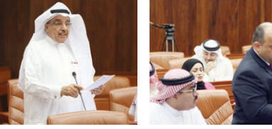
أينأنا، مضيفة أن وزارة التربية غير مستعدة لتنفيذ فكرة التعليم عن بُعد، لافتة إلى أنه منذ إكتمال المدارس لم تر سوى إكتمال هائلة من الرسوم والواجبات على البوابة الإلكترونية، في حين أنه ليس باستعانة الأهالي متابعة التعليم عن بُعد.

التعليم عن بُعد المقصود منه مطالبة وزارة التربية والتعليم بتبنيها نفسها في الفترة القادمة لتوفير البيئة المناسبة للتعليم عن بُعد وليس الآن، «مما سنعزل لو استمر الفيروس لفترات أطول، مضيفة أننا لسنا جاهزين الآن لتطبيق التعليم عن بُعد وما زالت مناهجنا تعتمد على وجود معلمين للتدريس في الصف، بالرغم من أننا بدأنا في العمل