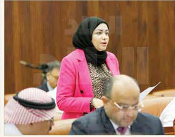
الحايكي، أولياء أمور ذوي الإعاقة يتكبدون مصروفات إضافية

وافق مجلس النواب على اقتراح برغبة لإنشاء مركز حكومي متخصص مؤهل من الناحية الفنية والبشرية، ومزود بجميع التجهيزات المطلوبة لتأهيل ذوي الإعاقة والتوحد، مع توفير متخصصين في التربية الخاصة.